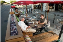
Parklets, un buen uso del espacio público