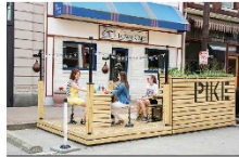
Bueno para los comercios, los residentes y para Market St.