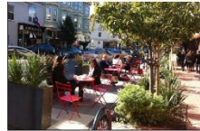
Una alternativa para recuperar el espacio urbano